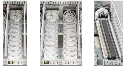
シングル スパイラル